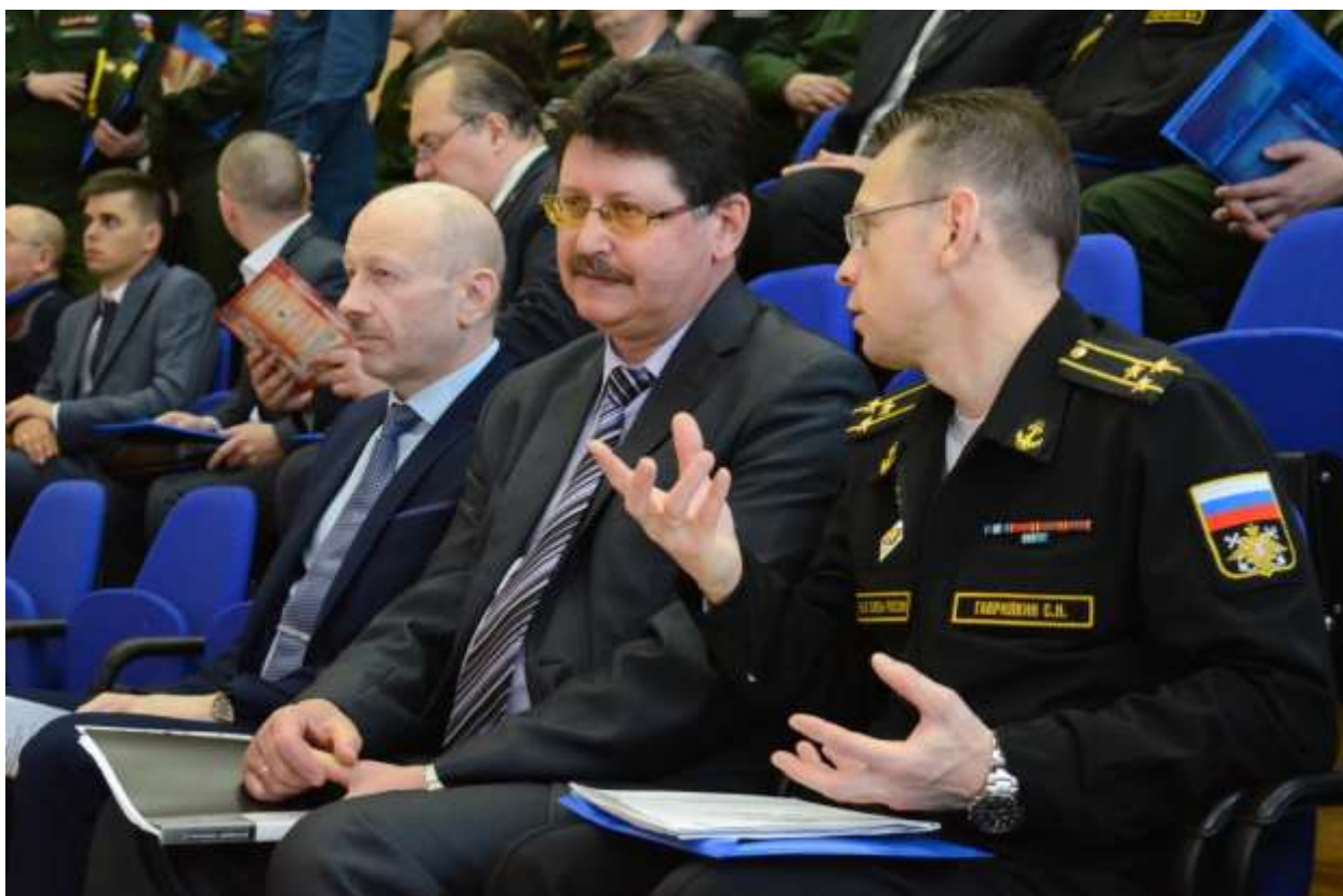
Участники конференции – представители научно-исследовательских организаций