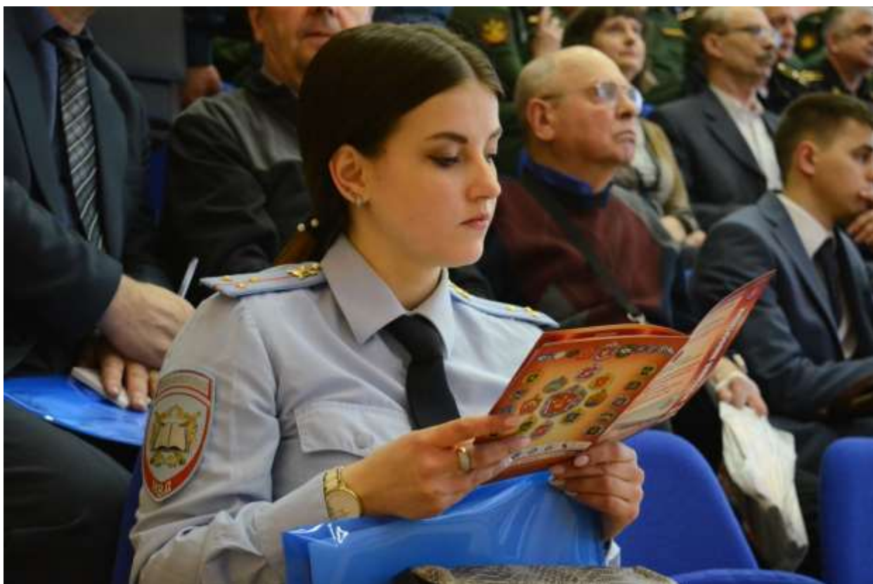
Участники конференции – представители образовательных организаций