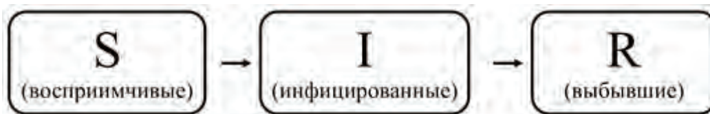
Рис. 2. Схема модели SIR

риоде, поскольку применение модели SIR в данной ситуации даст неудовлетворительный результат: инкубационный период будет вносить задержку в распространение инфекции.