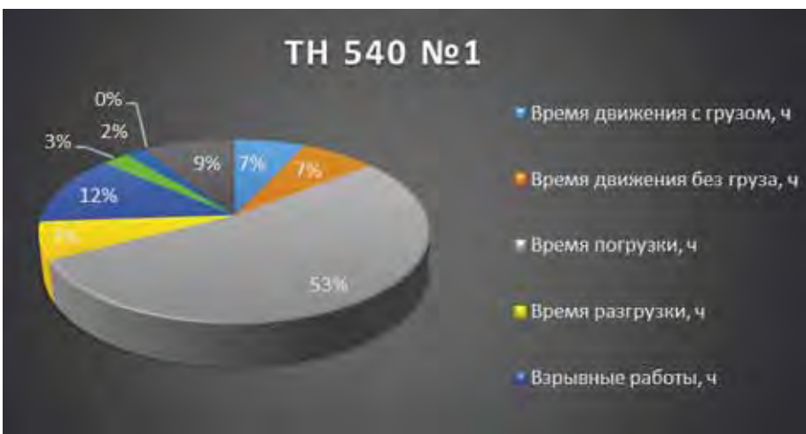
Рис. 3. Загрузка ШАС № 1, вариант «как будет»