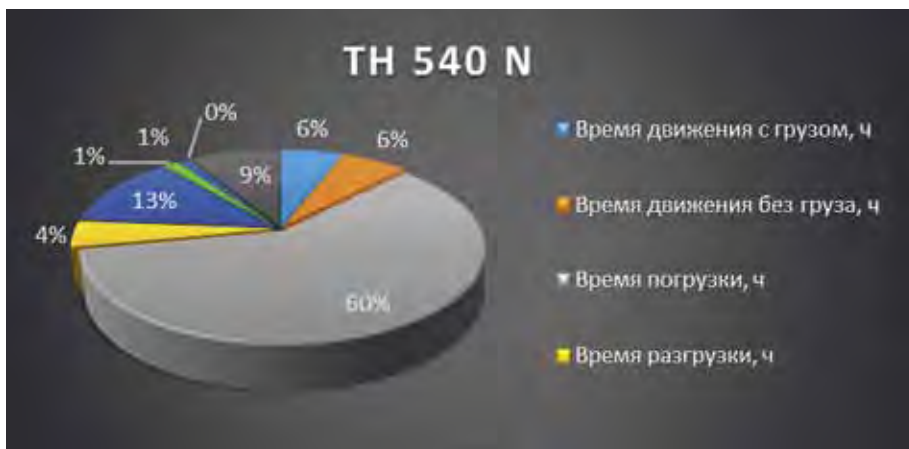
Рис. 4. Загрузка ШАС № 2, вариант «как будет»