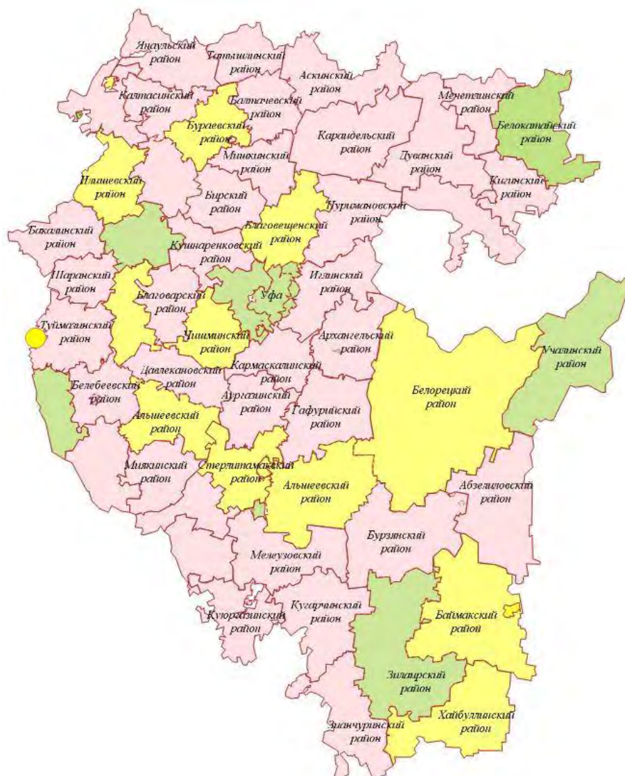
Рисунок 3. Прогнозная оценка уровня привлекательности муниципальных районов и городов РБ на 2026 год (составлено авторами на основе результатов АОМ)

Как мы видим, к 2026 году территории относящихся к первому кластеру не имеется, что говорит о снижении коэффициента привлекательности региона в целом. Потенциальными территориями для включения в этот кластер были г. Уфа и г. Салават, у которых наблюдается самый высокий темп снижения уровня привлекательности и увеличение числа выбывших, как внутри региона, так и за его пределами.