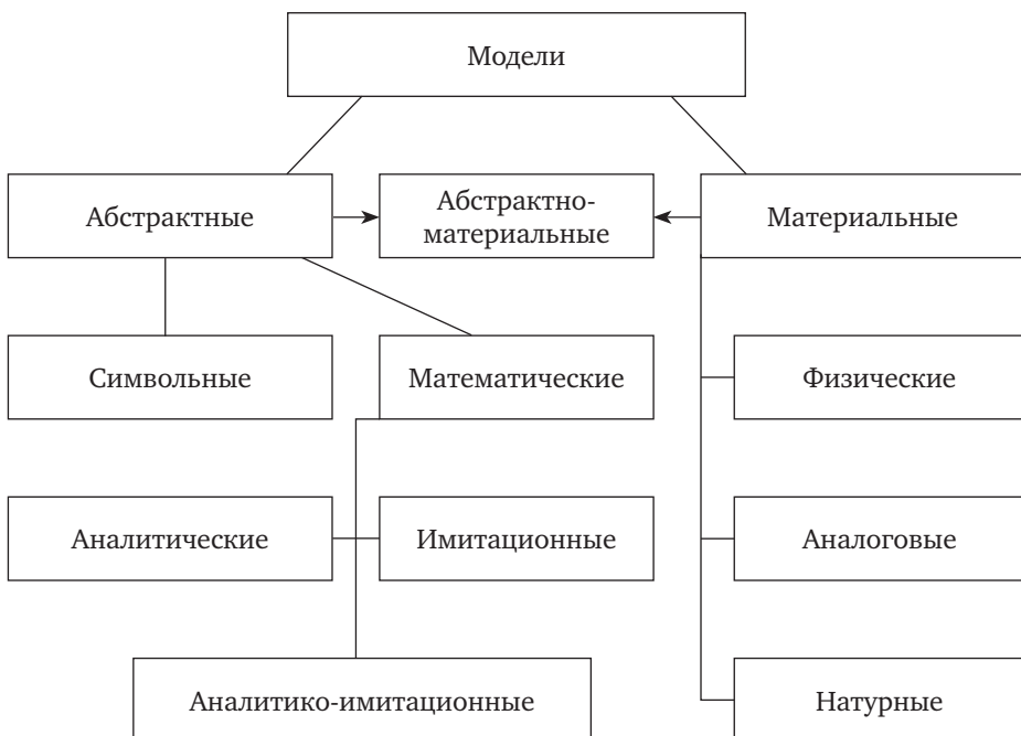
Рис. 1.3. Классификация по способу реализации модели

Символьная модель — это логический объект, замещающий реальный процесс и выражающий основные свойства его отношений с помощью определенной системы знаков или символов. Это либо слова естественного языка, либо слова соответствующего тезауруса, графики, диаграммы и т.п.