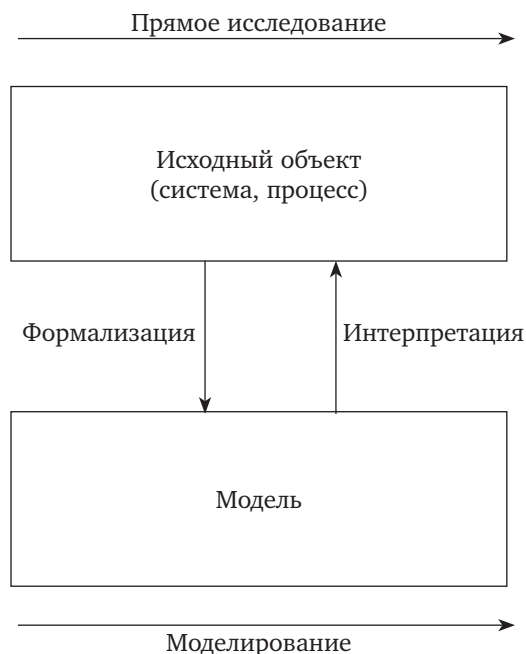
Рис. 1.1. К понятию «моделирование»

Моделирование — это замещение одного исходного объекта-оригинала другим объектом с целью получения информации о свойствах объекта-оригинала. Отсюда следует, что моделирование — это, во-первых, процесс создания или отыскания в природе объекта, который в интересующем исследователя смысле может заменить исследуемый объект. Этот промежуточный объект называется моделью (рис. 1.1).