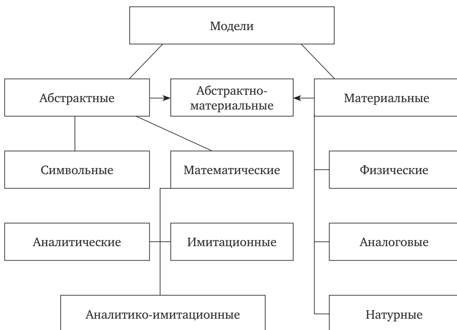
Рис. 1.3. Классификация по способу реализации модели

Символьная модель — это логический объект, замещающий реальный процесс и выражающий основные свойства его отношений с помощью определенной системы знаков или символов. Это либо слова естественного языка, либо слова соответствующего тезауруса, графики, диаграммы и т.п.