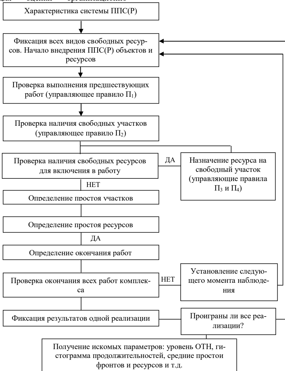
Рис. 2. Схема моделирующего алгоритма внедрения ППС(Р)

технологической надежности и установления различных зависимостей, имеющих важное практическое значение. При построении имитационной модели организации возведения строительных объектов использован один из основных принципов ситуационного управления: соизмерение совокупности управляющих правил с многообразием состояний моделируемой системы.