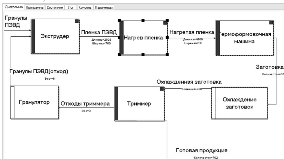
Рис. 3. Имитационная модель технологической линии Fig. 3. The process line simulation model

получена имитационная модель технологической линии по производству пластиковых стаканчиков. Общий вид модели показан на рисунке 3.