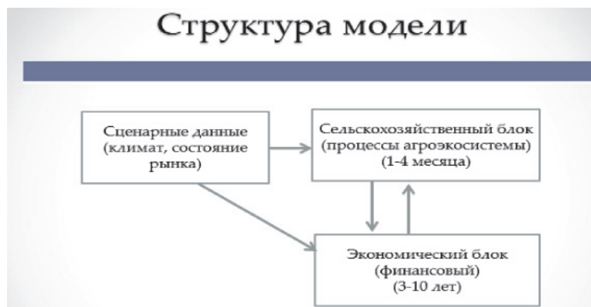
Рис. 1. Структура модели

Списание со счета Out(t) включают в себя