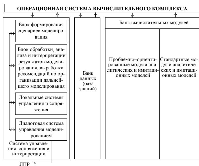
Рис. 2. Обобщенная структурная схема имитационной системы

Обобщенная структурная схема приведена на рис. 2. Кратко остановимся на основных положениях, определяющих построение имитационной системы в соответствии с данным определением. Структура математического обеспечения современных ИМС является иерархической. В основании данной иерархии моделей лежит базовое описание изучаемого объекта (в нашем случае ССВ), которое состоит из независимых (т. е. несвязанных между собой) моделей отдельных частей исследуемого объекта. Эти модели могут быть заданы как в формализованном виде (в математической форме), так и в неформализованном виде (в виде содержательной постановки на естественном либо на профессиональном ориентированном языке).