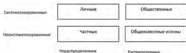
Рис. 1. Модель Бойкота

[2]. Согласно этой модели, интеллектуальный капитал компании складывался из нескольких составляющих: человеческой, организационной или потребительской. После этого интеллектуальный капитал стал рассматриваться, как один из важных источников конкурентных преимуществ компании. В ходе дальнейших исследований было разработано несколько подходов, позволявших дать количественную оценку человеческой, организационной или потребительской составляющей [3].