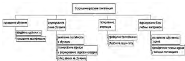
Рис. 4. Дерево целей