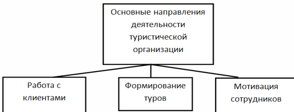
Рисунок 1 – Основные направления деятельности туристической организации

Клиентами организации могут быть как юридические, так и физические лица [10]. Можно сделать дифференциацию сотрудников относительно типа обслуживаемых клиентов.