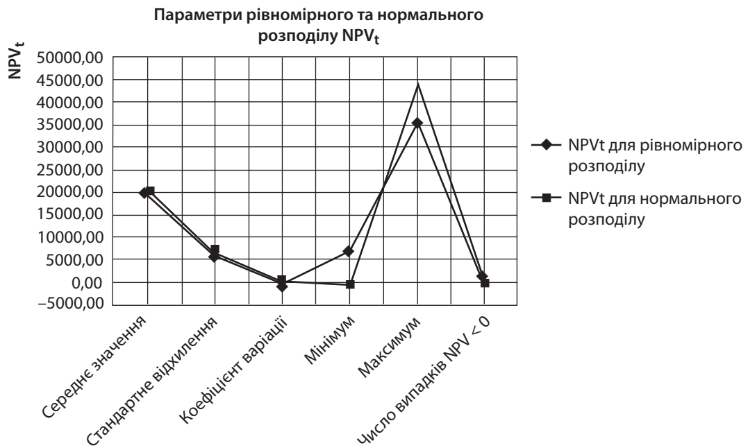
Рис. 6. Порівняння параметрів рівномірного та нормального розподілу чистої сучасної вартості проекту (NPV) за період t