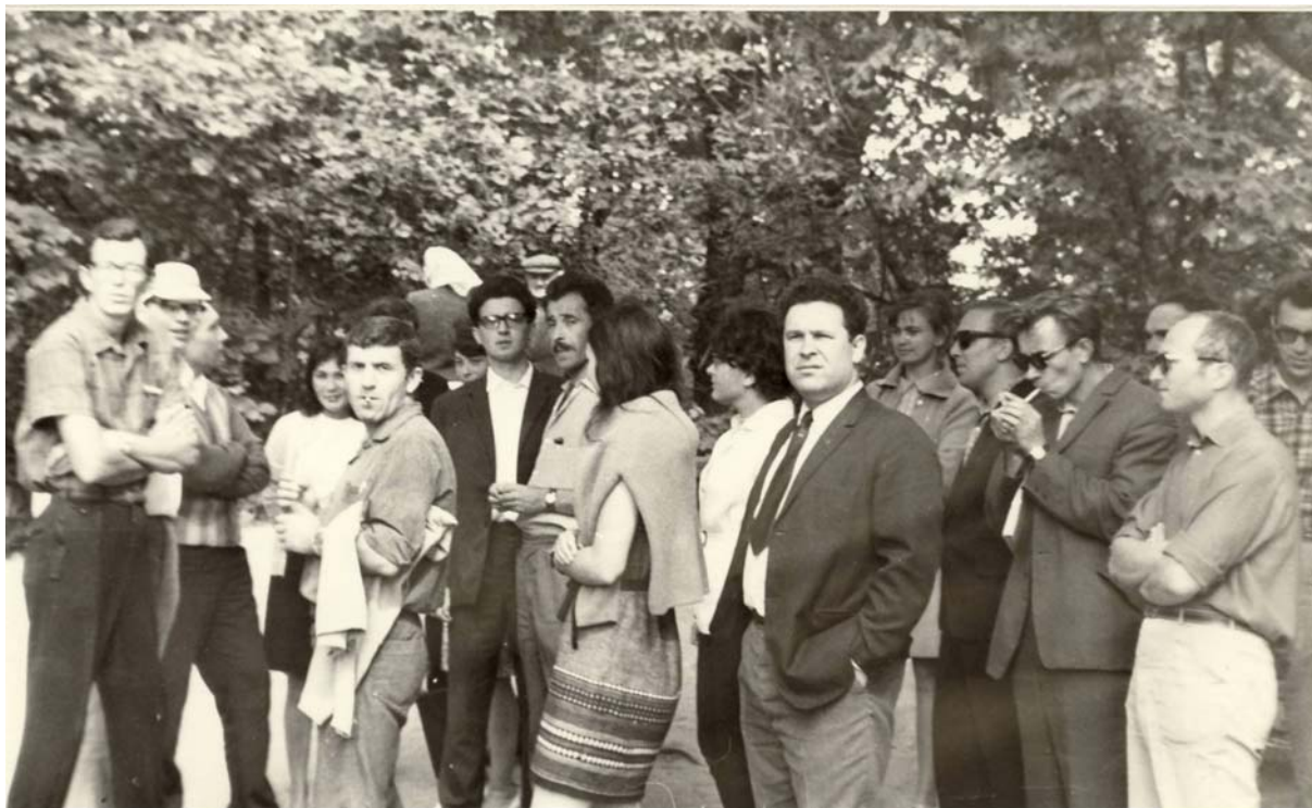
Рис. 3. 2-я школа-семинар по применению математических методов в теории биологических популяций и ценозов. Сигулда (Латвийская ССР, 1970 г.).

Только в марте 1973 года в Можжинке (Звенигород) под эгидой Научного совета АН СССР по проблемам биосферы была организована I-я официальная школа, целевым направлением которой было рассмотрение вопросов применения математических методов в биологии [1]. Именно ее многие нынешние исследователи и отождествляют с началом появления математической биологии в нашей стране, хотя к этому времени в течение четырех лет уже успешно функционировала неформальная школа, и было проведено четыре ее заседания.