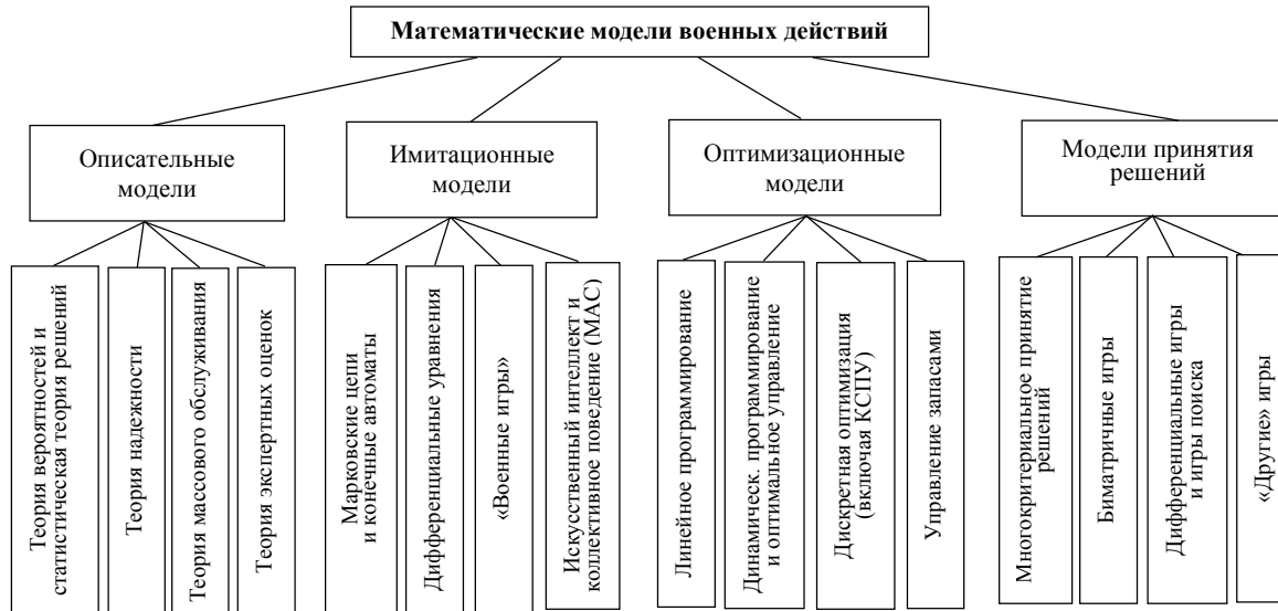
Рис. 1. Классификация математических моделей военных действий