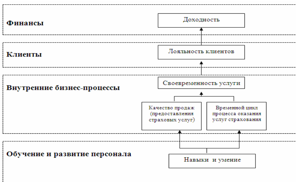
Рис.2. Фрагмент стратегической карты целей ССП страховой компании

Фрагмент стратегической карты целей сферы страховых услуг, сформированный автором диссертационного исследования, представлен на рис. 2.