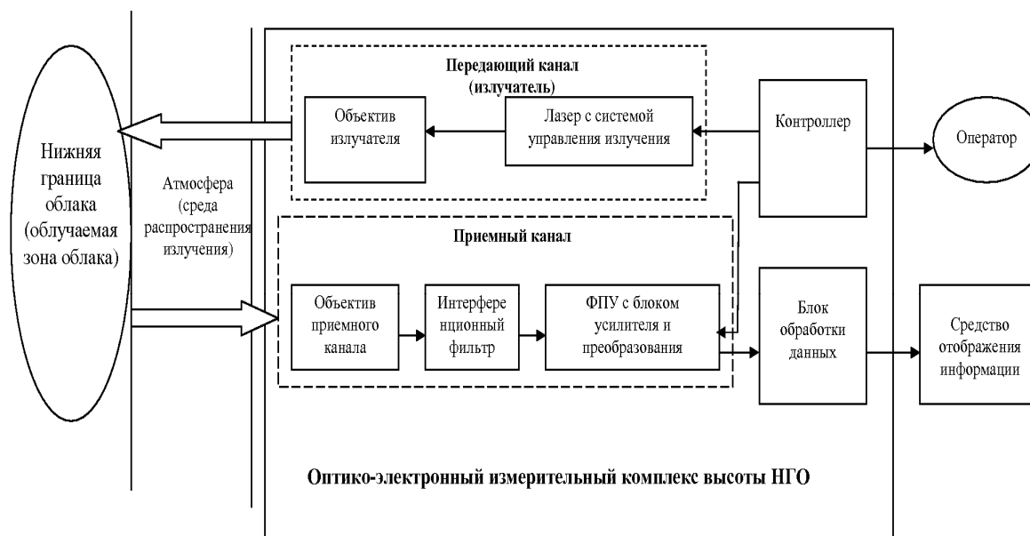
Рис. 1. Структурная схема оптико-электронного измерительного комплекса высоты нижней границы облака

ствий каждой из них требуется выполнение своих условий и ограничений. Эти условия и ограничения, как правило, известны и могут быть представлены в одной из форм, приемлемой для моделирования и реализации их в контроллере.