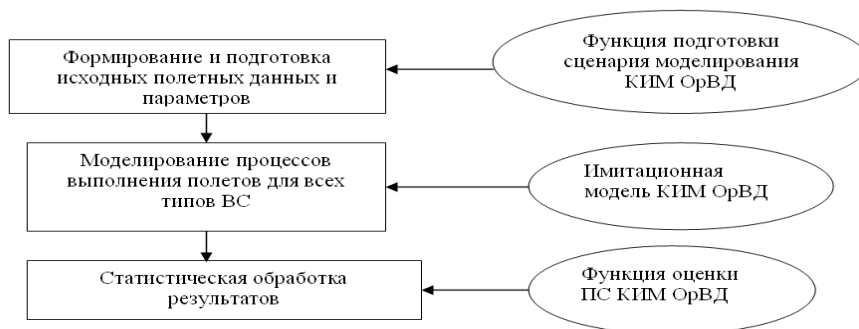
Рис. 1. Общая схема оценки пропускной способности элемента ВП

Схема проведения оценочных исследований по обоснованию характеристик ПС элемента ВП, основанных на имитационном моделировании, представлена на рис. 1.